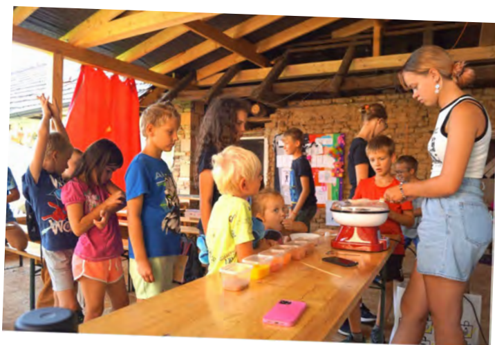
Příměstšák Velká plyšáková loupež v Pivíně (srpen 2023)

Hned druhý týden prázdnin jsme také zorganizovali brigádu, díky níž se významně posunulo budování zázemí v Komunitním centru Matky Markéty v Pivíně. Ke sportovnímu vyžití zde přibyl kulečník, volejbalové hřiště a fotbalové branky. K radosti našich dobrovolnic z řad maminek animátorů, které u nás na táborech vařily, přibyla i myčka na nádobí.