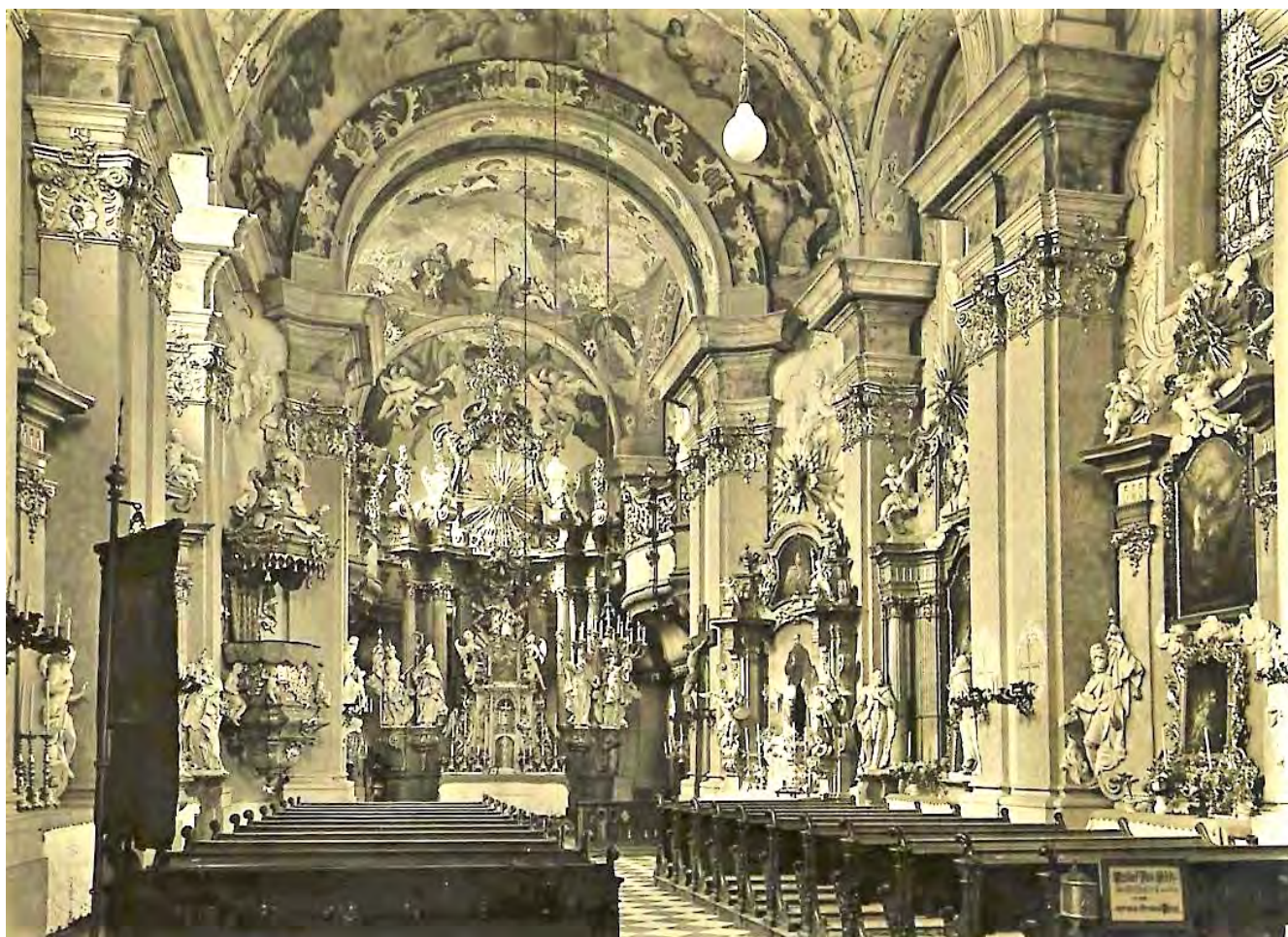
Interiér kostela sv. Jana Nepomuckého v Prostějově z počátku 30. let 20. století