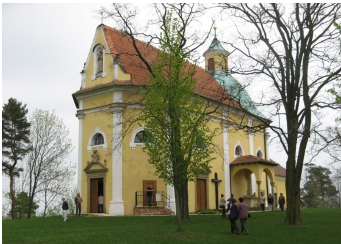
Kostel sv. Antonína na Blatnické hoře u Blatnice