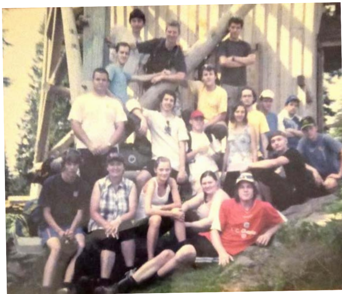
Cyklo-turistický tábor na Šumavě.