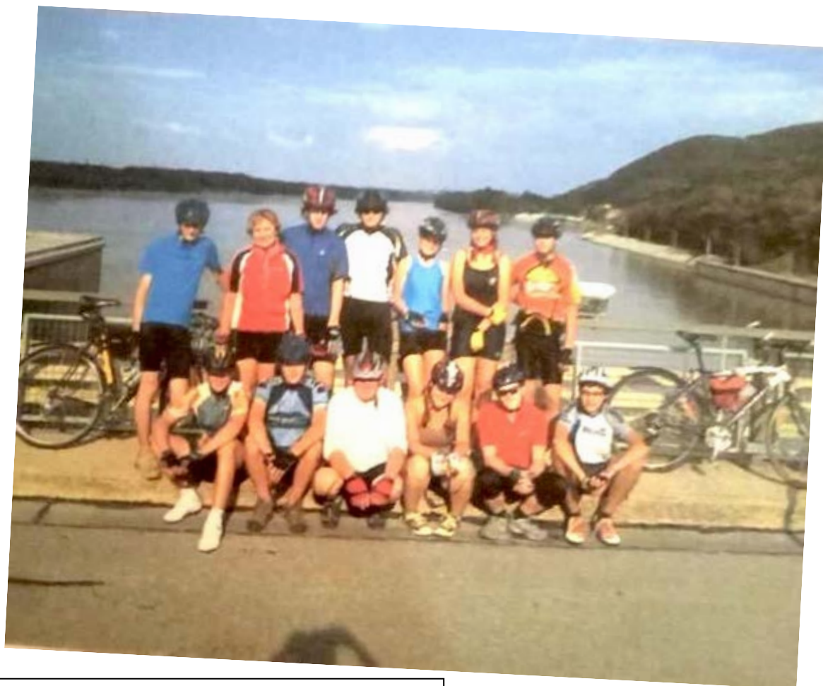
Cyklistický tábor 2010 Prostějov – Rakousko.