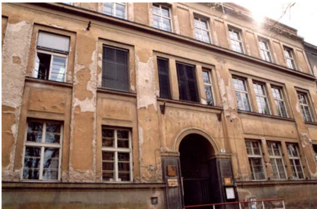
Původní stav budovy školy.