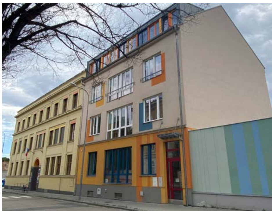
CMG a ZŠ v novém kabátě.