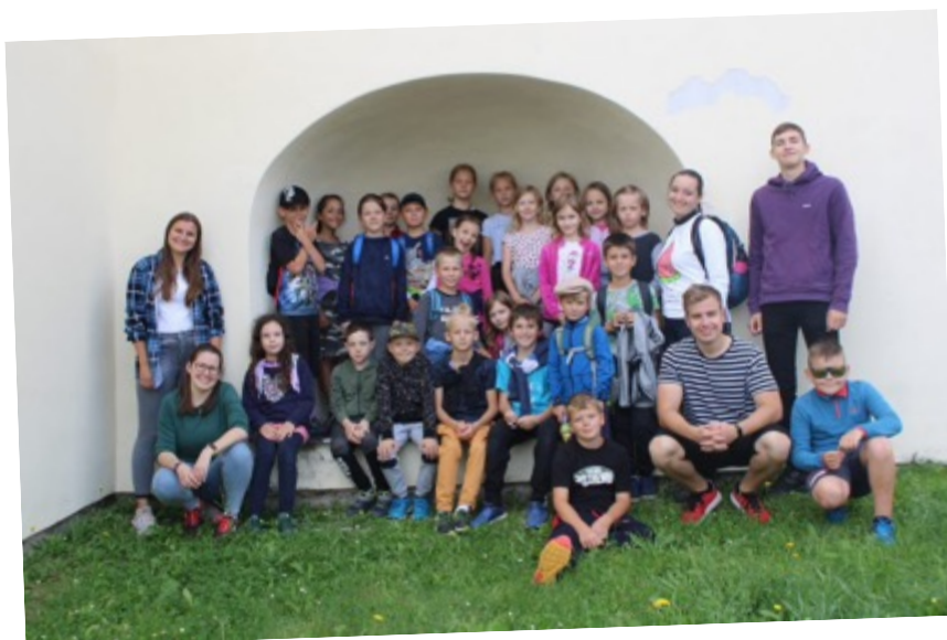
Tábor Akademie superhrdinů (červenec 2022).

Srpen pro nás začal stěhováním našeho sídla a materiálu do našeho nového Centra v Pivíně. Kdo chtěl přiložit ruku k dílu, zúčastnil se Příběžského tábora Na Maltě (5 účastníků, 7 animátorů), jehož cílem bylo připravit prostory tak, aby hned následující týden mohl proběhnout první pivínský Příběžský tábor pro děti s názvem Žofka ředitelkou ZOO (16 dětí, 7 animátorů). Prázdniny již jako tradičně uzavřel Rangers výcvik nových animátorů (21 účastníků, 6 animátorů) a Zamávání prázdninám (26 dětí, 5 animátorů).