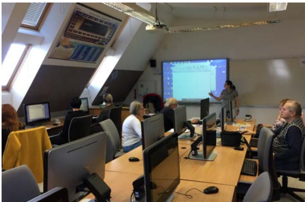
Počítačový kurz pro pokročilé začátečníky.

Pro pokročilejší uživatele jsou připraveny kurzy vyšší úrovně – Práce s flash diskem, Práce s fotografií, MS Excel pro začátečníky a Kurz Powerpointu. Účastníci tak mohou v průběhu roku získat ucelený soubor vědomostí a dovedností v práci na počítači.