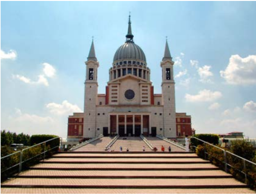
Basilica minor sv. Jana Bosca v jeho rodišti.

Samozřejmě bylo zastavení v Turínu – v katedrále sv. Jana Křtitele, kde v boční kapli je uloženo ono Turínské plátno.