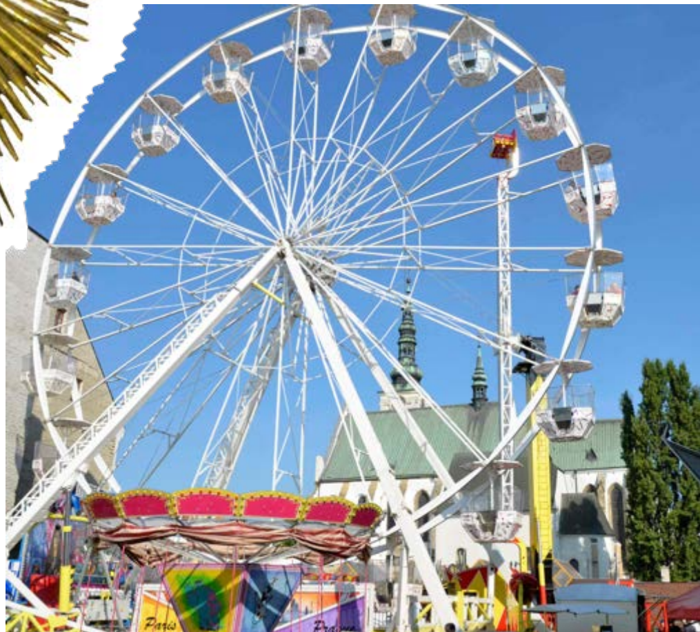
hody 2020