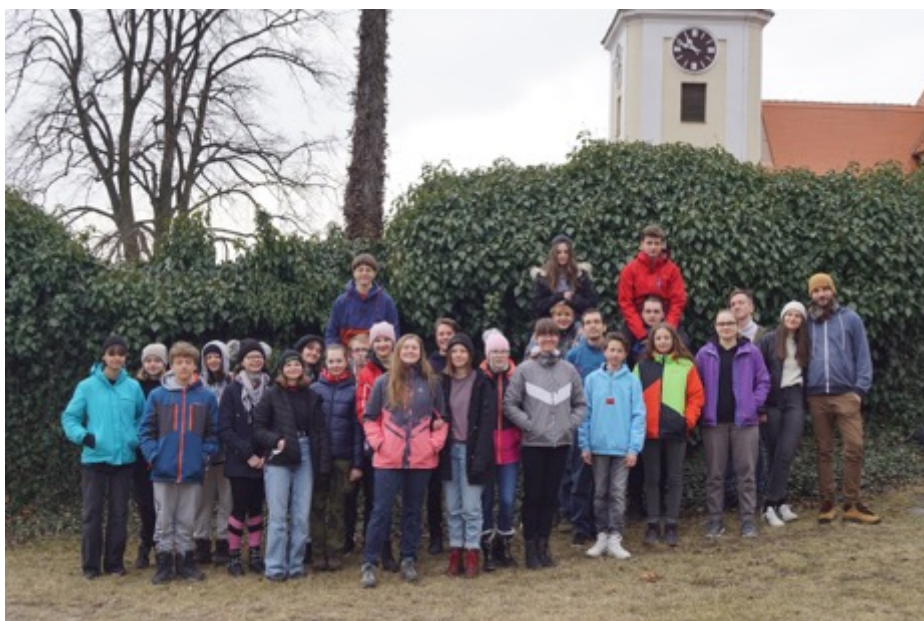
Vintíci na březnové duchovní obnově (březen 2022).

Naši animátoři neustále procházejí vzděláváním a letos jsme mezi námi s radostí přivítali 3 nové zdravotnice a 9 nových hlavních vedoucích. Do letošních táborů se také s vervou vrhla početná a nadšená parta našich nejmladších animátorů – Vintíků. Zakončila se tak tříletá, velmi dobrodružná a odvážná cesta 25 mladých lidí, kteří se rozhodli kus svého života obětovat práci pro druhé.