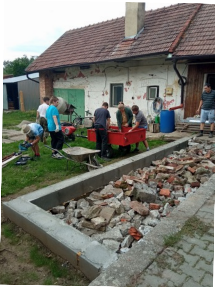
Příměstský tábor Na Maltě, práce na objektu v Pivíně (srpen 2022).

Největší změnou a zároveň výzvou uplynulého školního roku bylo hledání náhrady za prostory, které jsme donedávna měli na faře Povýšení sv. Kříže. V září 2021 se nám podařilo získat dům a přilehlý pozemek v Pivíně, kde jsme okamžitě odstartovali stavební práce a kam jsme letos přesunuli naše oficiální sídlo i veškerý materiál. S Boží pomocí a s úsilím mnoha animátorů se nám podařilo vybudovat nejnútnejší zázemí – toalety, kuchyňku a sál ke hrám, aby už letos mohl proběhnout první příměstský tábor přímo v Pivíně. Objekt jsme pojmenovali po mamince Dona Boska – Komunitní centrum Matky Markéty. Doufáme v její přímluvu i vedení, abychom i nadále pracovali v salesiánském duchu a po jejím vzoru věnovali všechny své síly ke spáse mládeže. Jak se nám daří v Pivíně, můžete sledovat na facebookové stránce Komunitní centrum Matky Markéty v Pivíně.