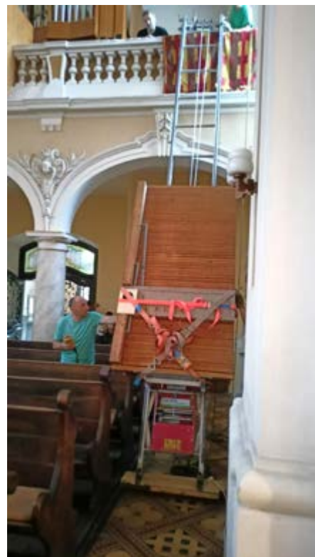
Největší a nejtěžší části varhan musely být na kůr vytaženy výtahem.

Již dlouho stála na kůru kostela sv. Cyrila a Metoděje prázdná varhanní skříň a bohoslužby doprovázel nástroj elektronický. Pokus nahradit poničený původní nástroj nástrojem novým v 90. letech se nevydařil a na kůru zůstala prázdná varhanní skříň bez stroje. Otec Pavel Barbořák nabídl kostelu a farnosti, že do skříně postaví nástroj, který vlastní, a farnosti ho zapůjčí. Ochotné ruce farníků uklidily z kůru i z varhanní skříně vše, co překáželo, a přestěhovaly na kůr nový nástroj – písňaly, vzdušnice