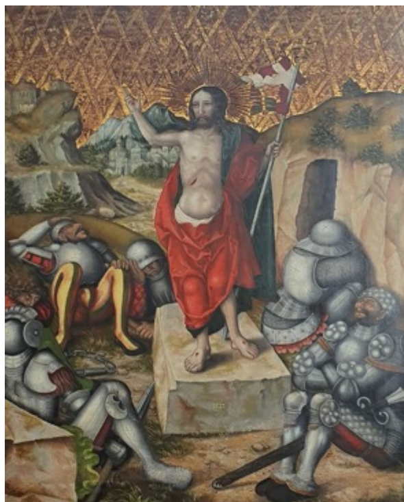
Zmrtvýchvstání od Hanse Hesseho

V centru, v srdci má znít modlitba, v srdci města i v srdci člověka. Již po staletí tuto službu nekonají augustiniáni, ale duchovní srdce města neumklo, je pro nás místem, kde se naše srdce obrací a pozvedá k Bohu. A tak zkusme nikdy neprojit kolem kostela bez zastavení se, většinou je otevřený kostel, nebo alespoň předsíň. Určitě to není ztráta času, právě naopak! K tomu, aby naše duše mohla hodovat a nestrádat, nežíznit a nehladovět, je příležitost každý den a nic to nestojí!