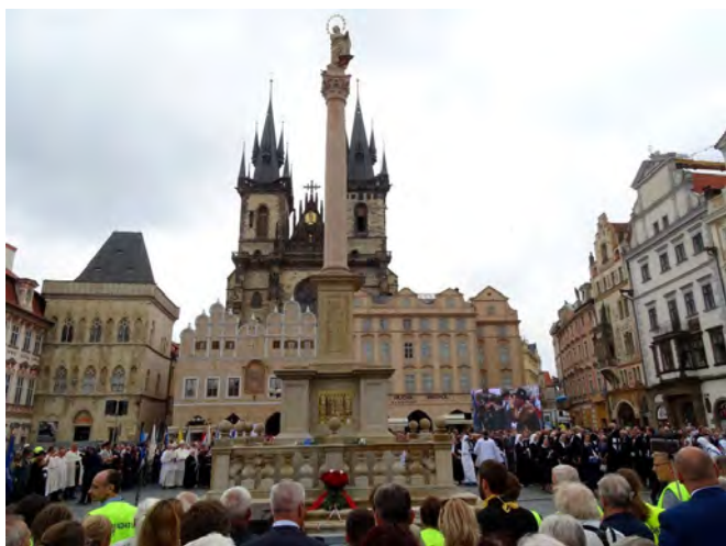
Požehnání Mariánského sloupu 15. 8. 2020.

Tato pouť do Prahy ovlivnila můj život na dlouhá léta. V následujícím roce 1989, když padl totalitní režim, jsem se ihned zapojil do aktivit na obnovu sloupu a stal jsem se zakládajícím členem Společnosti pro obnovu Mariánského sloupu na