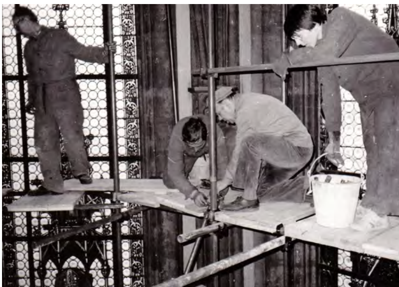
Oprava kostela Povýšení sv. Kříže 1989.

I po pádu režimu jsem v roce 1992 pomáhal brigádnicky při malování kostela sv. Petra a Pavla v Prostějově. Později, v roce 1996, jsem organizoval opravu kostela sv. Markéty v Biskupicích. V letech 2008 - 2013 jsem vedl