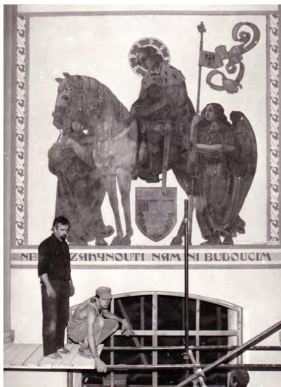
Oprava kostela Povýšení sv. Kříže 1989, freska Jano Köhlera.

mou účast na opravách sakrálních památek užitečná. Všechny tyto práce měly zvláštní vlastnost. Krásnou, radostnou a těžko popsatelnou atmosféru spolupráce