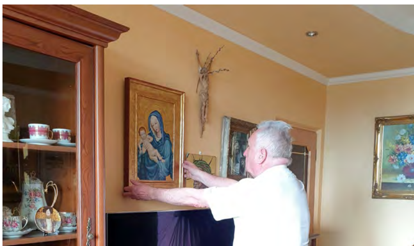
Snímání obrazu Panny Marie Rynecké v červnu 2020.