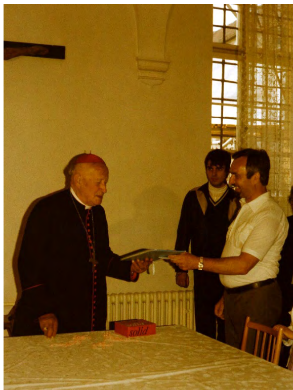
Audience u kardinála Tomáška 1988.

Po audienci jsme se vydali po královské cestě na Staroměstské náměstí. Tam jsme podle vyznačeného pražského poledníku v dlažbě našli místo, kde stával Mariánský sloup. Utvořili jsme kolem toho místa kruh a vykonali pobožnost k Panně Marii. Prosili jsme za odčinění její urážky v roce 1918 a za obnovení sloupu. V tom okamžiku jsem pocítil silnou touhu něco konkrétního pro obnovu Mariánského sloupu udělat. Nevěděl jsem co, nevěděl jsem kdy a ani jak. Tenkrát v květnu 1988 nikomu z nás ani na mysl nepřišlo, že ta možnost je již tak blízko. Po modlitbě na