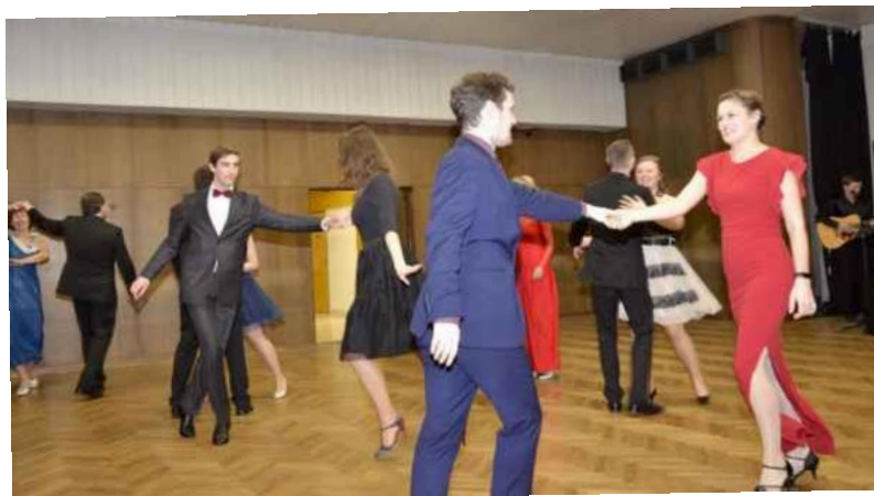
Nejenom tanec ...

Dne 21. 2. 2020 se konal, jako tradičně v Domě služeb na Olomoucké ulici, další z mých oblíbených plesů. Pravidelní účastníci i nově příchozí mohli být svědky zdařilého večera i noci. Tento příjemný čas je potřeba zorganizovat dopředu a je spousta detailů, o které se organizátoři snažili, aby celek tvořil pro nás účastníky krásný zážitek. Chtěla bych poděkovat všem, které jste měli možnost vidět, i těm