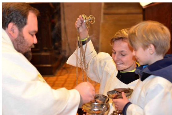
Velikonoční vigilie 2019

A to je pro nás útěchou v tyto dny, které přinášejí obavy z budoucnosti. Jsme děti Boží, od Krista nás nemůže nic odloučit. Jistota vycházející z toho, že nás Bůh přijal za vlastní, ať překoná všechny nejistoty tohoto světa!