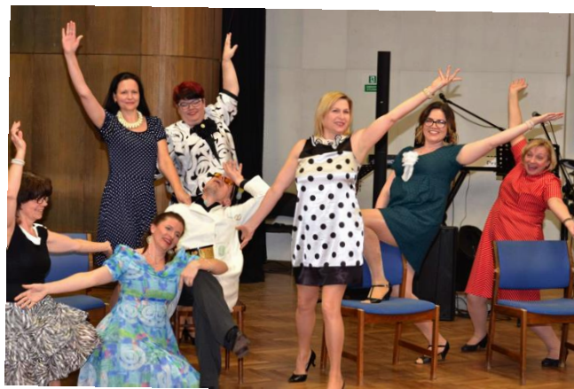
... scénky ...

Můj již v pořadí třetí farní ples byl opět skvělý, nejen díky úžasné organizaci, super kapele, ale hlavně díky lidem, se kterými jsem sál sdílela. S lidmi oplývajícími přátelstvem, pokorou a lidskostí. Nezasťírám svoje obavy z první návštěvy, kdy jsem se jako nevěřící ocitla mezi těmito lidmi. Ale jejich přijetí a vřelost mě oslovily natolik, že jsem si ples pokaždé užila. Poznala jsem, že víra v Boha neznamená, že se nemůžete bavit,