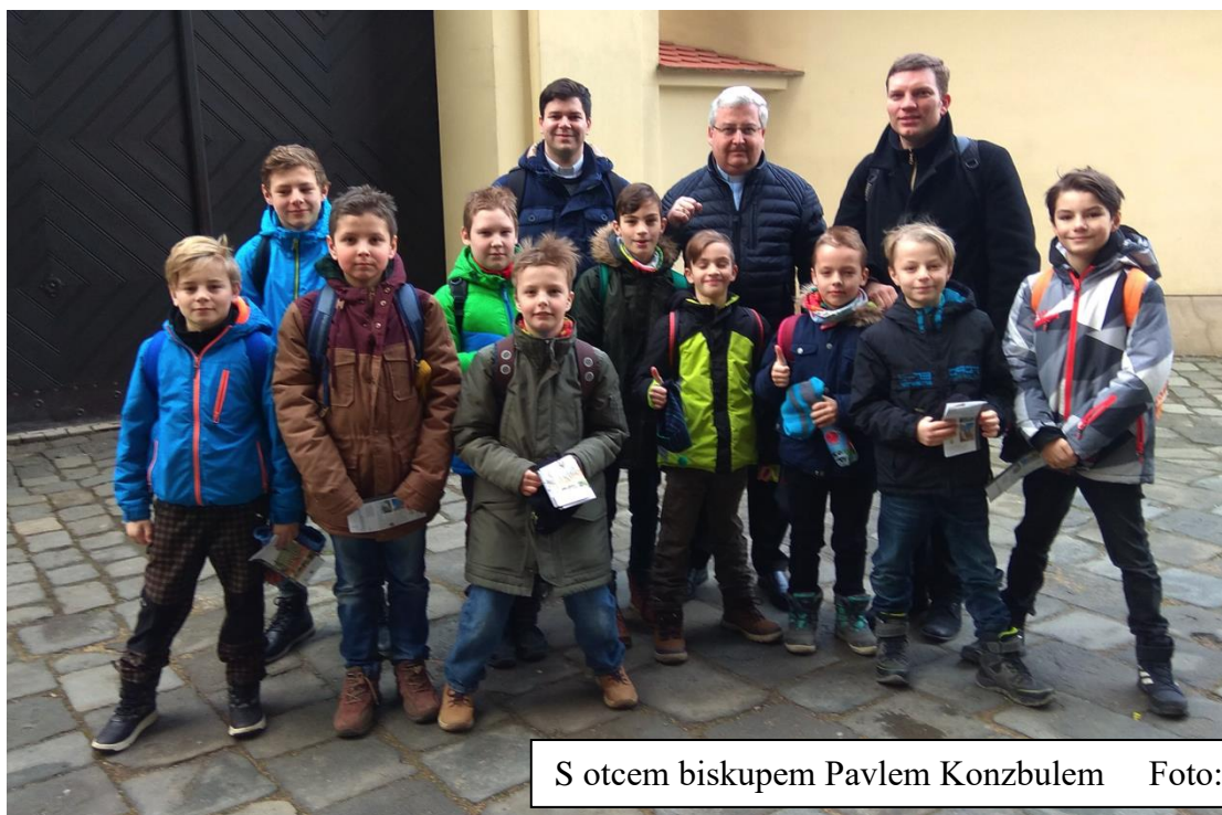
S otcem biskupem Pavlem Konzubulem