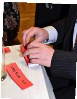
... tombola ...