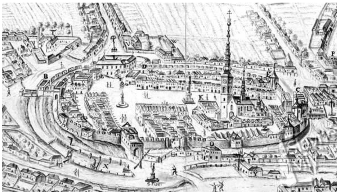
Prostějov na malbě Františka Velehradského z roku 1728

Původ této slavnosti a rozšíření úcty k sv. kříži je asi v zázračné události z r. 1697 , kdy při velikém požáru skoro celého města i far. kostela jedině dřevěný kříž u vchodu kostelního zůstal v plamenech neporušen a byl po obnově chrámu slavně postaven na hl. oltář.