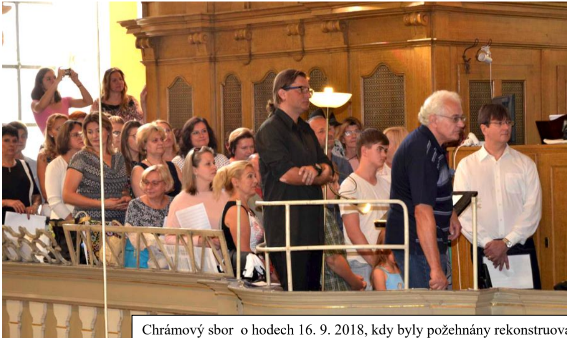
Chrámový sbor o hodech 16. 9. 2018, kdy byly požehnány rekonstruované varhany.