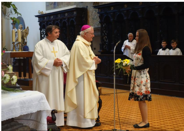
Otce biskupa přivítala zástupkyně maturantů.