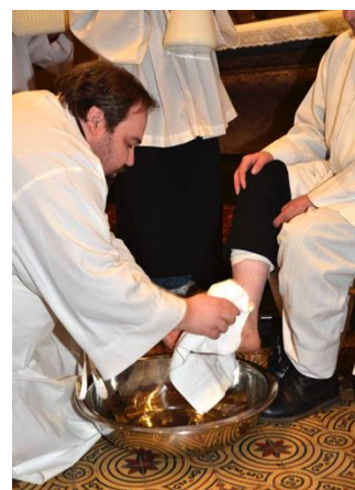
Mytí nohou na Zelený čtvrtek 2018