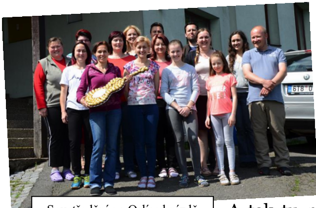
Soustředění na Orlím hnízdě

Schola při kostele sv. Cyrila a Metoděje je společenství mladých lidí, které se snaží svým zpěvem sloužit Bohu a pomáhat spolufarníkům k hlubšímu prožití mše svaté. Heslo naší scholy je: „Dá se to zazpívat i hezky.“ ☺