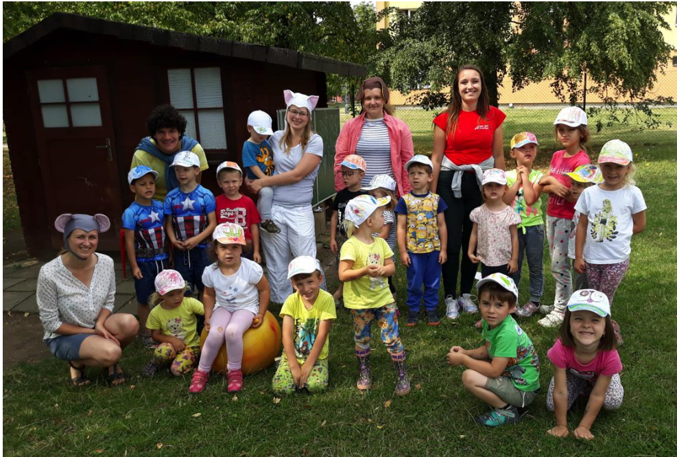
tábor Příměstská školka

Fotky z táborů najdete na www.shmpv.cz .